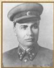
генерал-полковник Кирпонос Михаил Петрович Начальник училища (март 1934 г. – декабрь 1939 г.)