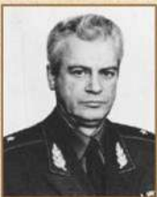
генерал-майор Турчик Юрий Владимирович Начальник училища (август 1984 г. – август 1987 г.)