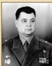
генерал-майор Кобяков Иван Григорьевич Начальник училища (август 1963 г. – июнь 1975 г.)