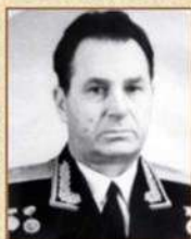
генерал-майор Соколенко Алексей Луиич Начальник училища (июль 1975 г. – август 1984 г.)